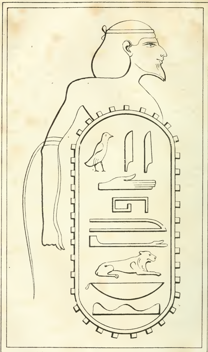
Royaume de Juda, personnifié dans le portrait de ROBOAM, FILS DE SALOMON.

Trouvé par M. Champollion parmi les peuples vaincus par Sésac, et représentés sur les murs du palais de Karnac.